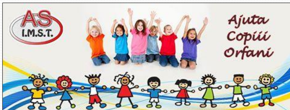
Ajută un copil, spune o poveste!