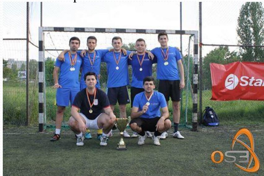
Cupa Regiei la Fotbal