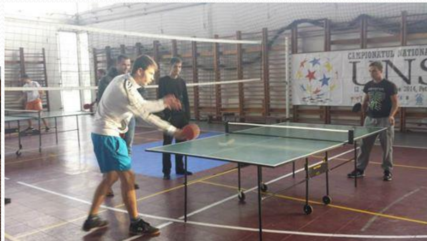
Campionatul de tenis de masă