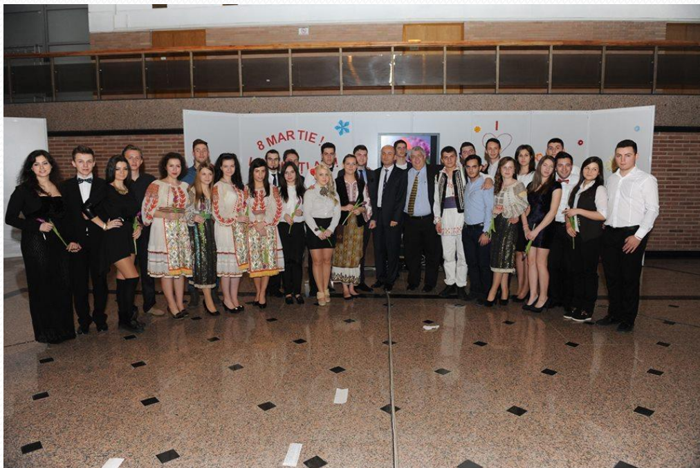
Spektacol organizat de către studenții facultății I.M.S.T. cu prilejul Mărțișorului și a zilei de 8 Martie