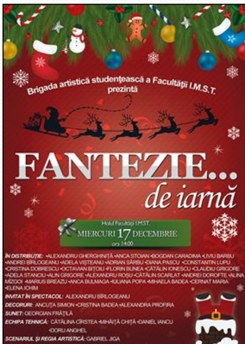
Spectacol de Crăciun 2014-2015