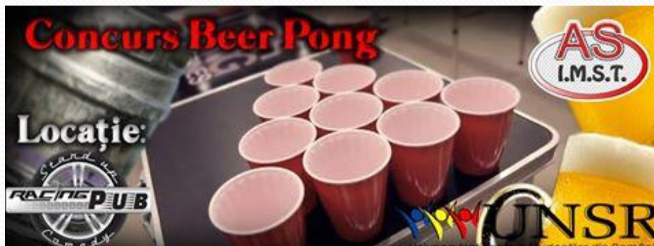
Concurs Beer Pong – 18 Nov. 2014